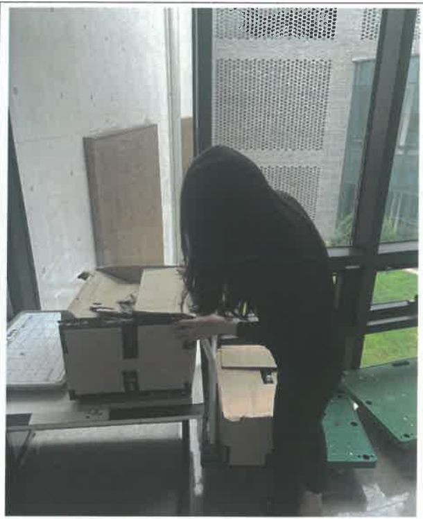
(사무실 비품 관리 점검)