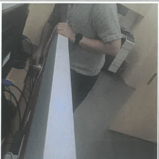
학술연구부 사무실 전기 콘센트 점검