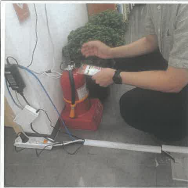
학술연구부 사무실 소화기 점검