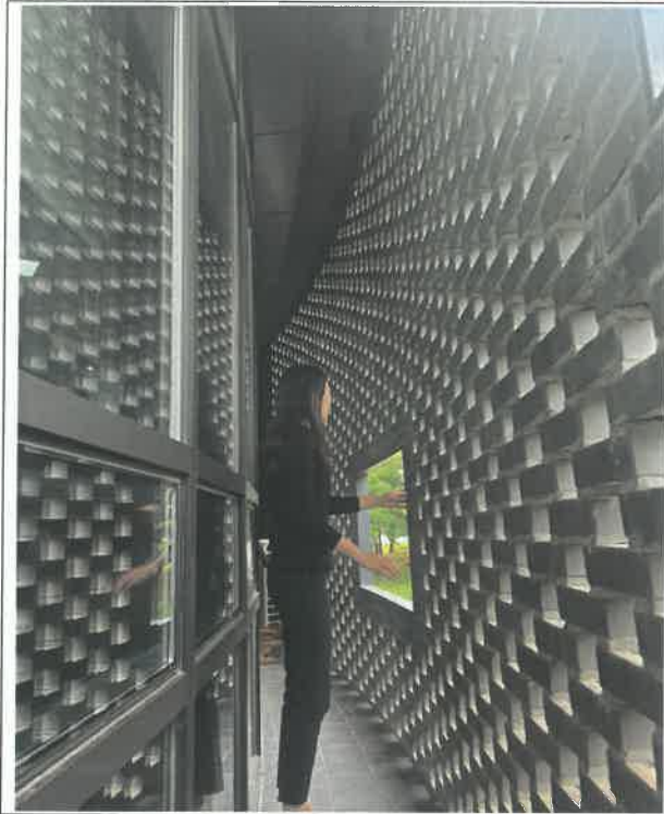
(사무실 외부 테라스 관리(별집여부) 점검)