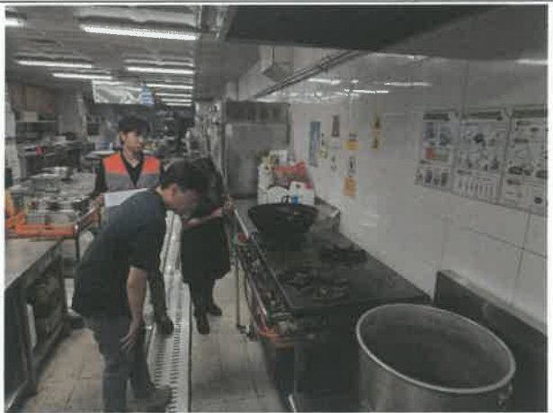
위험성평가 실시(구내식당 등)