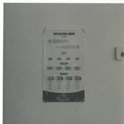
(컨벤션홀(대국민 장소대관) 부근 홍보물 부착)