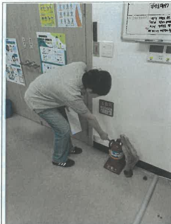
(고객소통부 사무실_소화기 점검)