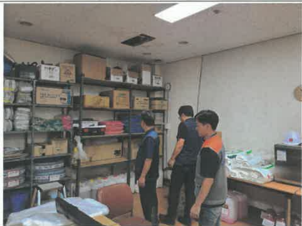
위험성평가 실시(미화 자재창고)