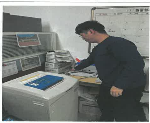
문어발식 연결상태 등