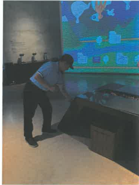
(전시관_전시시설물의 안전상태 점검)