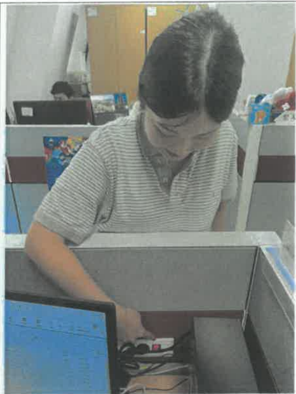
(고객소통부 사무실_전기 콘센트 점검)