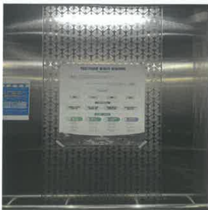
(겨레누리관 엘리베이터 내 홍보물 부착)