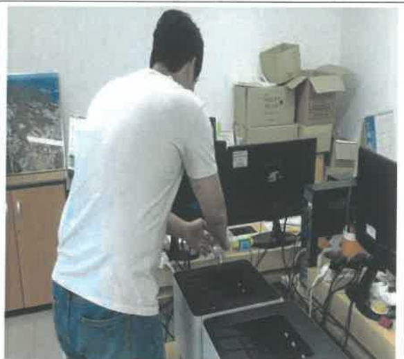
겨레누리관 2층 광복80주년 미래발전 TF팀 사무실 (콘센트 육안점검)