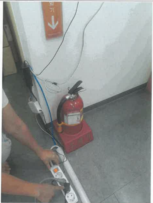
학술연구부 사무실 전기 콘센트 점검