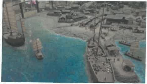
체험전시물 안전상태 확인