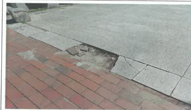
행사 이후 관 내 점검