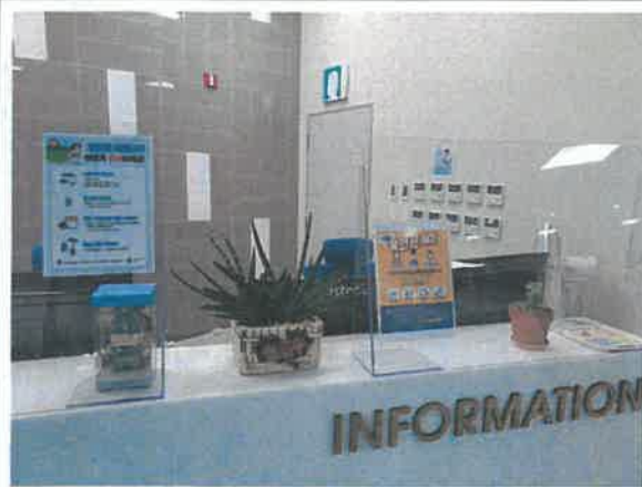
1F 로비 안내데스크_관람객 여름 건강 캠페인