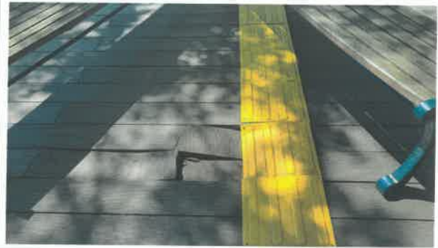
행사 이후 관 내 점검