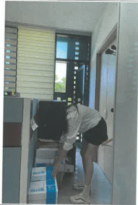
사무실 비품 적재상태 점검