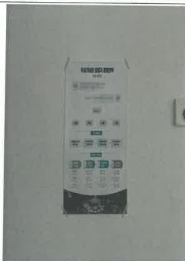
(컨벤션홀(대국민 장소대관) 부근 홍보물 부착)