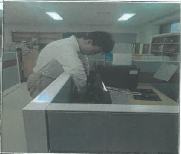
(겨레의 집 4층_콘센트 점검)