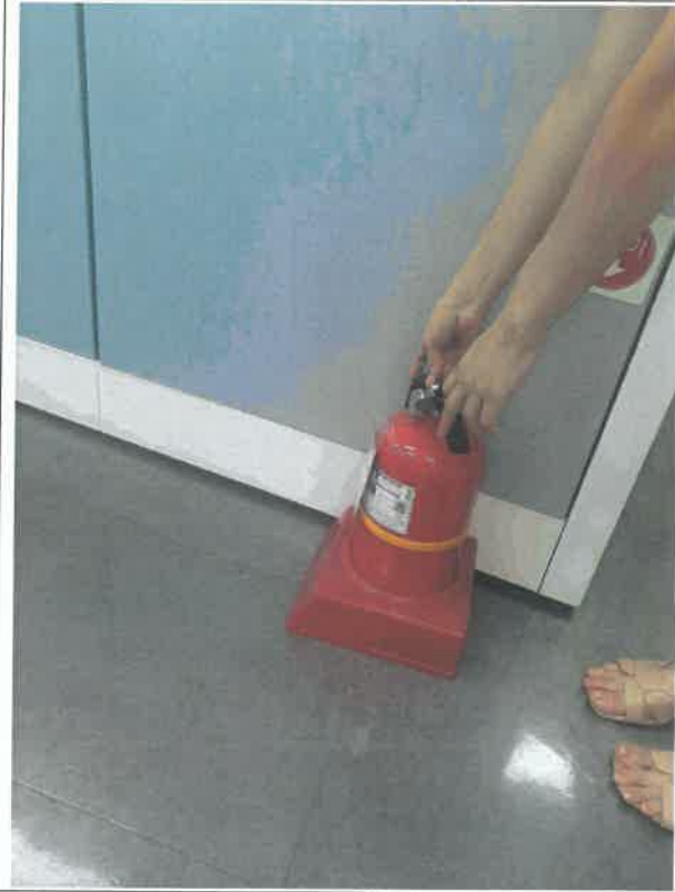
학술연구부 사무실 소화기 점검