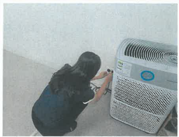
(사무실-콘센트, 멀티탭 점검)