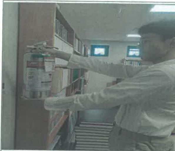
(겨레의 집 4층_소화기 점검)