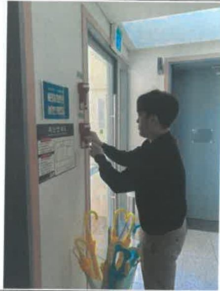
(밝은누리관_휴대용 조명등 점검)