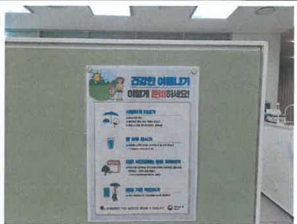
3F 사무실_직원 여름 건강 캠페인