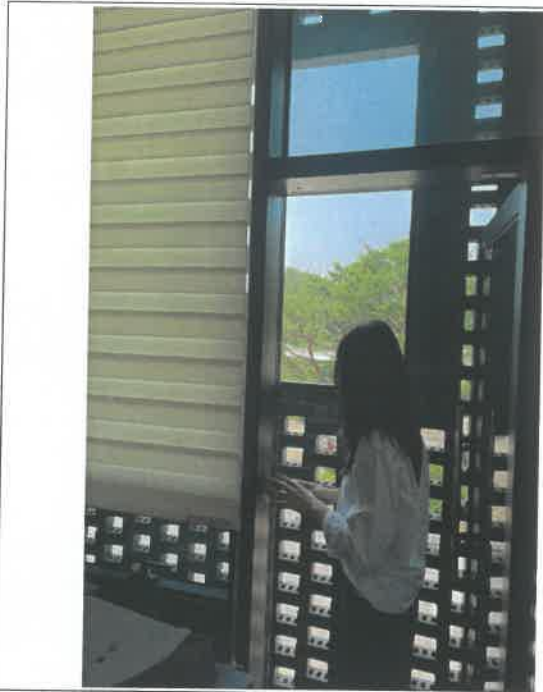
사무실 내부 발코니 안전관리 상태 점검