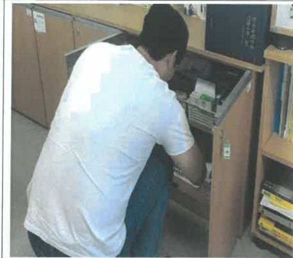
겨레누리관 2층 광복80주년 미래발전 TF팀 사무실 (사무장비 및 비품 보안 안전관리 상태 점검)