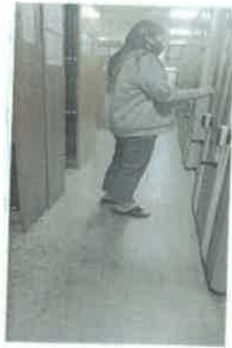
(도서실_모바일 작동 점검)