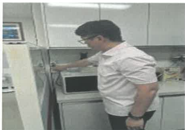
문어발식 연결상태 등